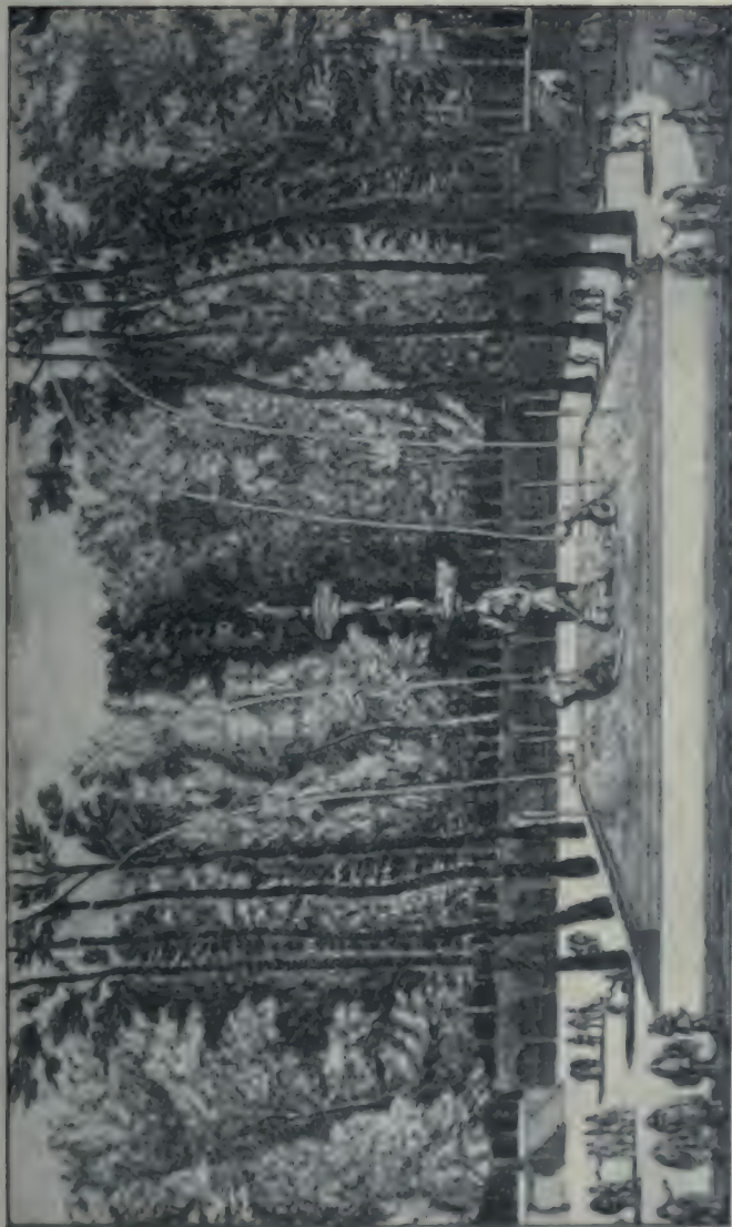
La Fontaine des Tritons à Aranjuez.

Gravure du XVIII e siècle. (Bibliothèque Nationale. Estampes.)